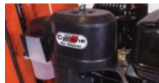
FILTRU AER CYCLONIC